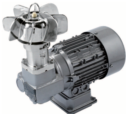
Obr. 1 – Magnetické míchadlo Alfa Laval