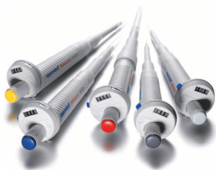
Obr. 1 – Eppendorf Reference® pipety

V současné době vyráběné pipety Eppendorf jsou plně autoklávatelné, mají unikátní odpružený kónus pro zaručenou správnou sílu nasazení špičky, jsou snadno kalibrovatelné a servisovatelné. V nabídce jsou též 8 kanálové a 12 kanálové verze a elektronické pipety Xplorer® s intuitivním ovládním a širokou škálou dodatečných aplikací – například opakované dávkování, ředění, míchání atd.