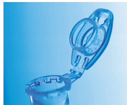
Obr. 3 – Eppendorf DNA LoBind® zkumavka

mikrolitrové objemy – tzv. eppendorfka. Měla objem jako dnes – tedy 1,5 ml a za krátko na to i 2 ml a k ní byla vyvinuta ještě také mikrocentrifuga na tyto zkumavky. Vše se výborně uplatňovalo, náramně dobře prodávalo a značka Eppendorf se stala světoznámou.