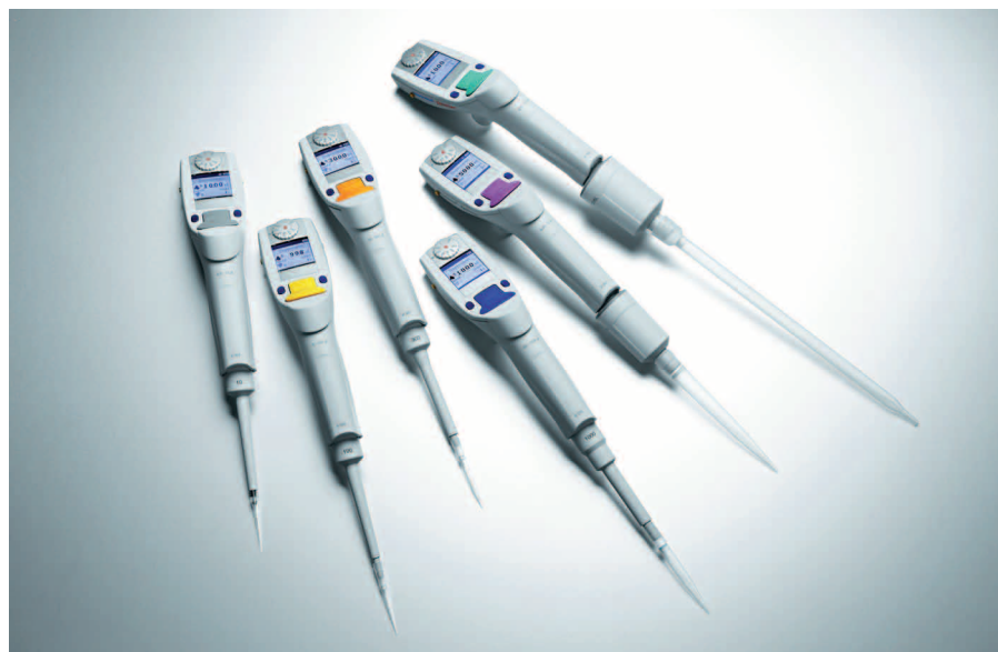
Obr. 4 – Eppendorf Xplorer® elektronické pipety

Eppendorf Czech & Slovakia s.r.o., Eppendorf@eppendorf.cz