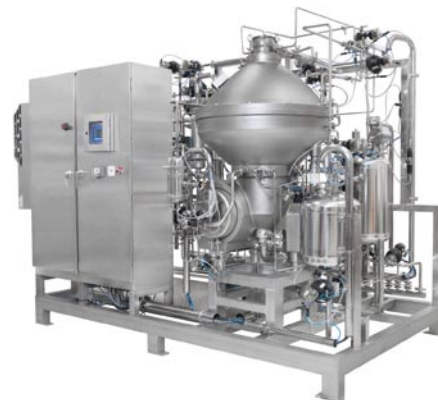
Obr. 3 – Modul Culturefuge 400

Získávání buněk pro přípravu nových vakcín a léků se přesunulo z oblasti science fiction do reality, částečně také díky plátku kuřete a separátoru, který započal oddělování mléka od smetany a nyní pomáhá získávat tu nejcennější komoditu ze všech, dobré zdraví.